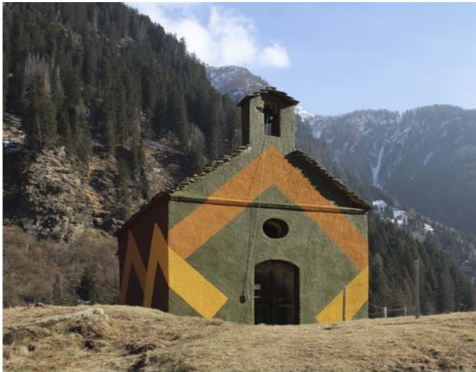
Cappella delle C 11. Vista dal bas 12. Vista della fa 13, 14. Vista di facciata ovest