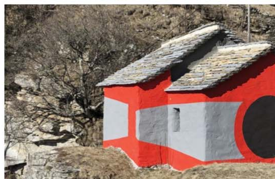
Cappella di Santa Maria Maddalena del Calvario 16. Dettaglio facciata est. 17. Vista dall'alto. 18. Vista facciata est.